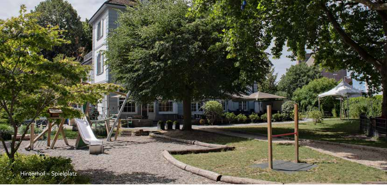
Hinterhof – Spielplatz